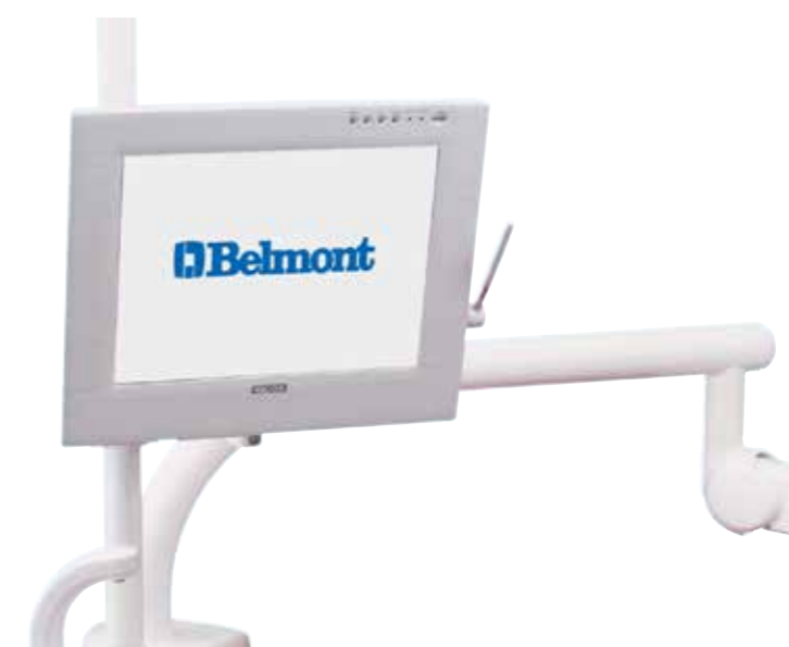
Braccio per monitor odontoiatrico